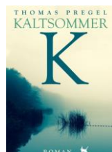
Kaltsommer Roman ISBN: 978-3-95771-083-3