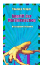
Angriff der Maismenschen Dystopische Novelle ISBN: 978-3-95771-208-0