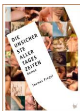
Die unsicherste aller Tageszeiten Roman ISBN: 978-3-942223-28-7