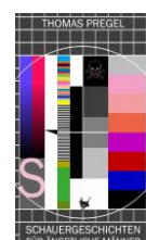
Schaugeschichten für ängstliche Männer Novelle ISBN: 978-3-95771-168-7