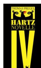
Hartznovelle Novelle ISBN: 978-3-942223-90-4