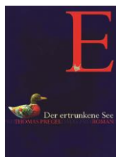
Der ertrunkene See Roman ISBN: 978-3-95771-059-8